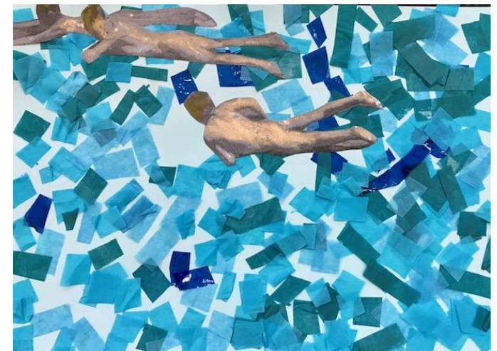
Niños en la playa. Joaquín Sorolla.